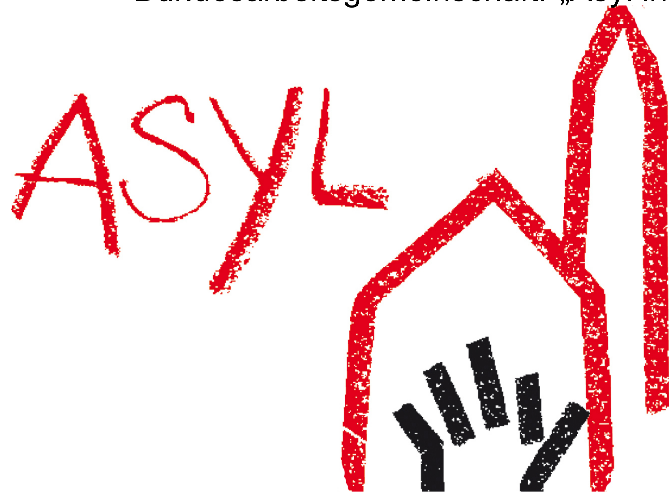
Ökumenische Bundesarbeitsgemeinschaft (2016): http://www.reformiert-info.de/daten/Image/Bild_Upload_Orig/14095_org.jpg .

Logo der ökumenischen Bundesarbeitsgemeinschaft: „Asyl in der Kirche“