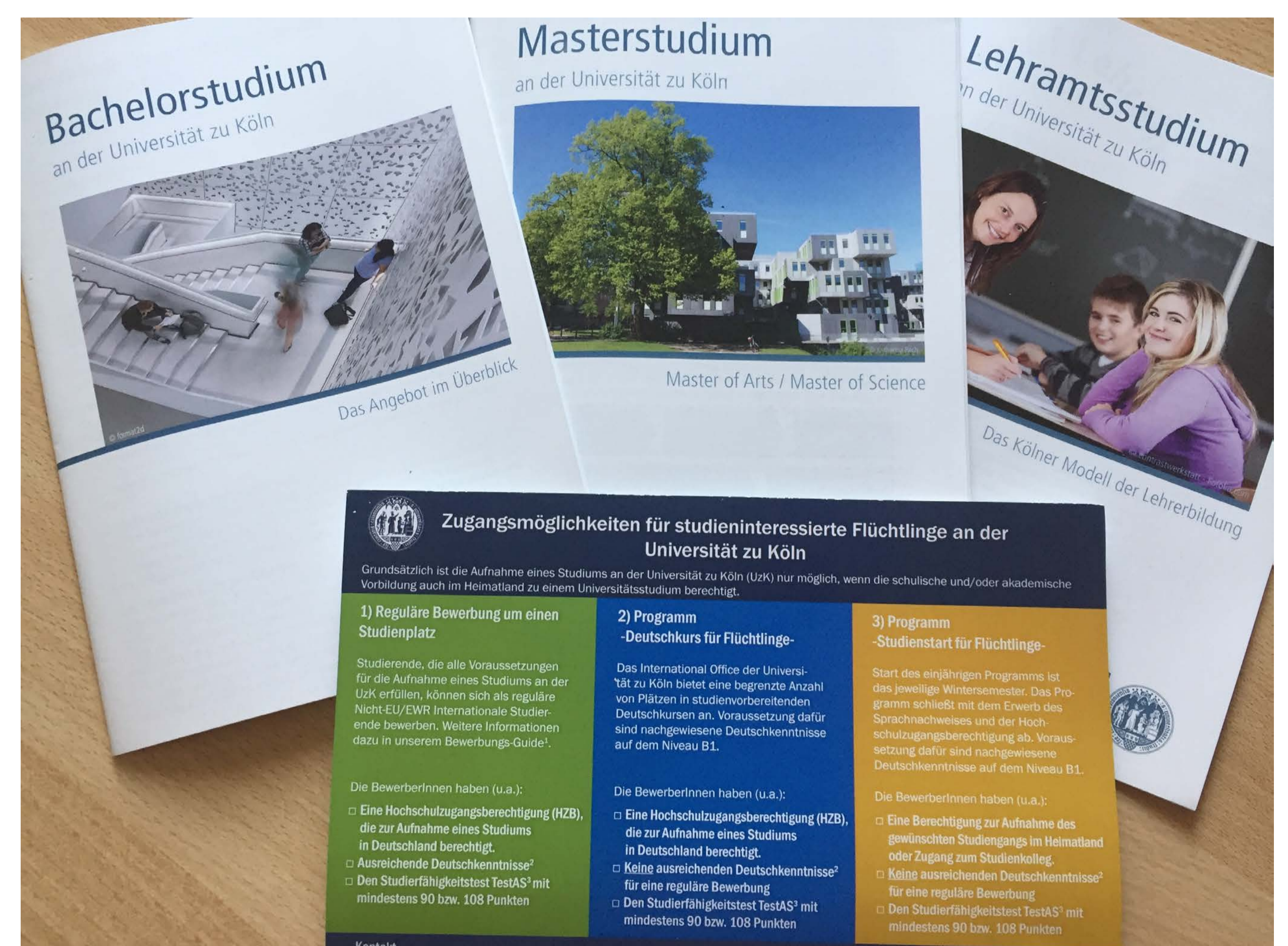
Informationsbroschüren für Geflüchtete über ein Studium an der Universität zu Köln, Winter 2016.

Die Geflüchteten, die eine Ausbildung begonnen haben, waren größtenteils noch nicht lange in Deutschland.