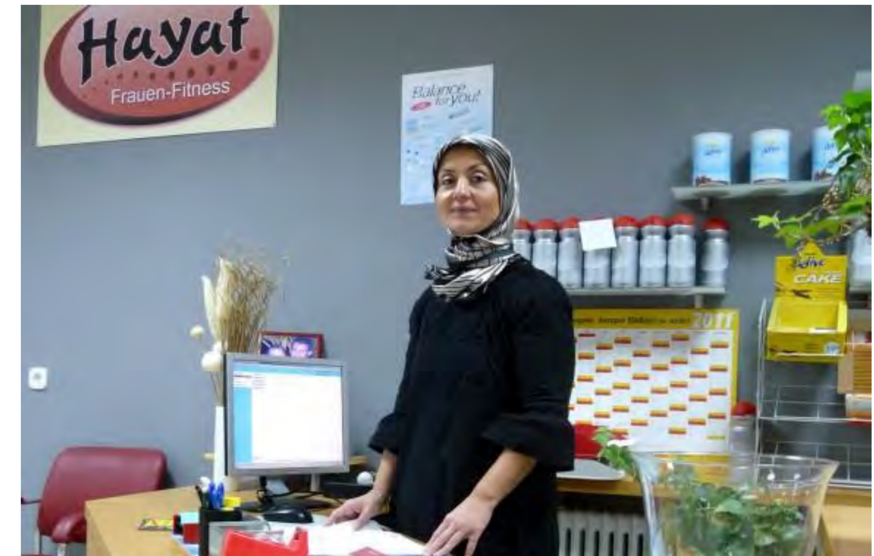
DIE WELT online

Die meisten Frauen hatten davor schon in anderen Studios trainiert oder sonstigen Sport getrieben. Die Befragten würden auch in einem anderen Frauen-Fitnessstudio Sport treiben.